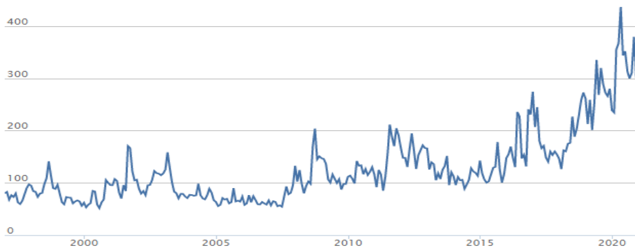
Figura 1: Indicele global al incertitudinii politicii macroeconomice

Un studiu publicat in luna aprilie 2021, care se bazeaza pe indicele mentionat precedent, conclide ca incertitudinea cu privire la deciziile macroeconomice nu este stationara, adica nu depinde de timp ci de alti factori si ca un nivel ridicat al acesteia are un efect negativ semnificativ in ceea ce priveste deciziile investitionale. Mai mult de atat, studiul ajunge la concluzia ca incertitudinea la nivel de tara determina investitorii sa adopte o strategie bazata pe ultimele informatii aparute si nu pe contextului general. Totodata, tarile mai dezvoltate au o tendinta de a fi mai afectate de deciziile economice ale altor tari decât țările subdezvoltate. In tabelul de mai jos prezentam indicele global al incertitudinii politicii macroeconomice.