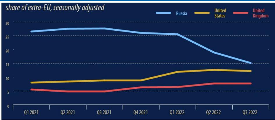
Figura 1: Importurile de energie ale UE, T1 2022 – T3 2022

Potrivit datelor publicate Eurostat, ponderea Rusiei in importurile de energie din UE a scazut cu peste 10 puncte procentuale intre primul si al treilea trimestru din 2022, de la 25,5% la 15,1%. In al doilea trimestru din 2022, ponderea combinata a Statelor Unite si a Marii Britanii era cu 1,4 pp mai mare decat cea a Rusiei, iar aceasta diferenta a crescut la 4,8 pp in al treilea trimestru din 2022. In al treilea trimestru al acestui an, importurile de energie din Statele Unite au reprezentat 12,2% din total, iar cele din Marea Britanie 7,7%.