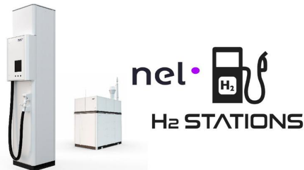
Figura 2: Statie de alimentare cu hidrogen

Norvegianul Nel , producator de tehnologie cu hidrogen cu emisii zero, isi extinde operatiunile in 2021 pentru a-si face produsele mai competitive. Nel produce electrolizatoare utilizate pentru a obtine hidrogen verde din apa, precum si echipamente de alimentare cu hidrogen. Conform strategiei companiei, scopul este de a permite clientilor sa produca hidrogen verde la 1.5 USD/kilogram in anul 2025, astfel incat sa fie mai avantajos decat alternativele fosile.