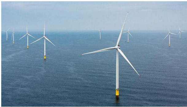
Figura 1: Turbine eoliene pe apa

Siemens Gamesa și Siemens Energy vor dezvolta o turbina eoliana comerciala care va produce hidrogen prin electroliza. Acest lucru reprezinta o descoperire pentru productia in masa de hidrogen regenerabil, care va putea inlocui combustibilii fosili, iar astfel va contribui la atingerea obiectivului Uniunii Europene pentru reducerea emisiilor de carbon. Companiile vor investi 120 de milioane de euro in acest proiect. Odata cu aceasta investitie va creste si cererea pentru hidrogen, dorindu-si sa atraga clienti industriali mari.