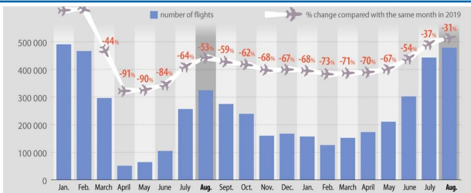
Figura 2: Zborurile comerciale din anul 2021