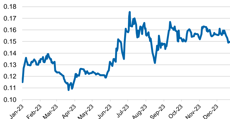
Evoluția cotației acțiunii BRK în 2023

În anul 2023, prețul acțiunii BRK a avut o evoluție destul de volatilă. La începutul anului, în ianuarie 2023, prețul s-a situat în jur de 0,1336 lei/acțiune, cunoscând apoi fluctuații importante în primele luni ale anului. Ulterior, în luna aprilie 2023, prețul a scăzut la aproximativ 0,1202 lei/acțiune. Începând cu luna mai 2023, prețul a început să crească și a avut o tendință generală ascendentă până la sfârșitul anului, maximul fiind atins la nivelul de 0,1595 lei/acțiune, în luna iulie. În ultima zi a anului 2023, acțiunile BRK au închis la 0,1495 lei/acțiune.