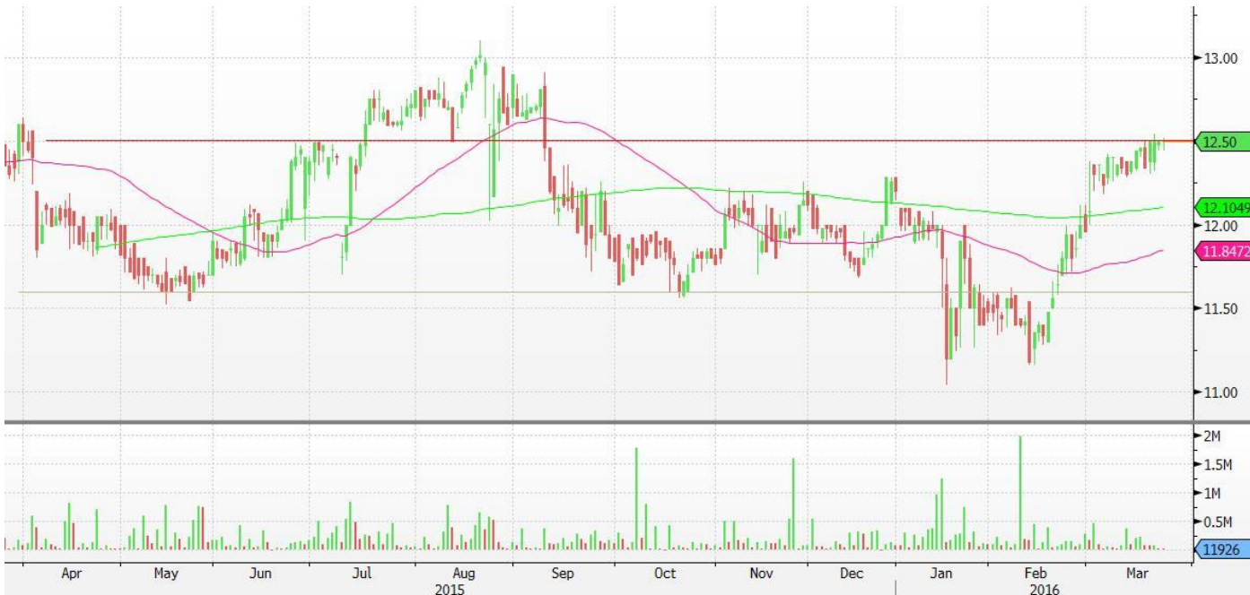
EL RO Equity (Electrica SA) Candle Chart Daily 25MAR2015-24MAR2016 24-Mar-2016 09:16:58