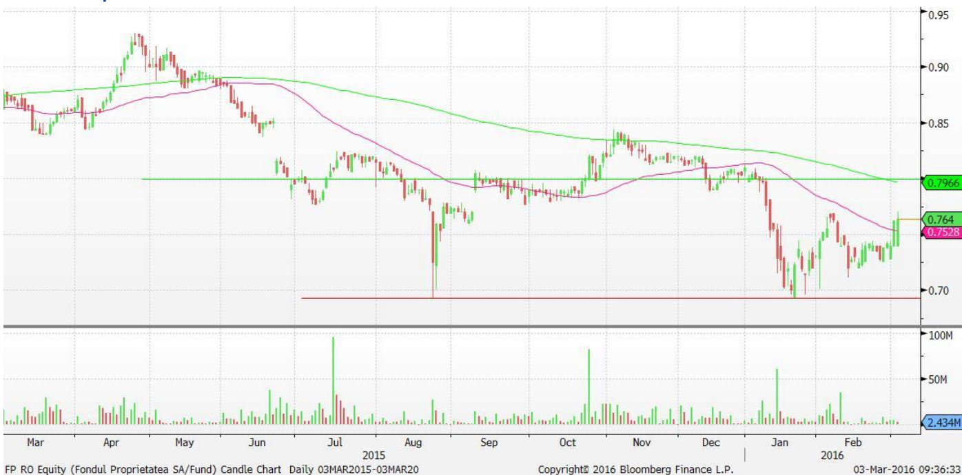
FP RO Equity (Fondul Proprietatea SA/Fund) Candle Chart Daily 03MAR2015-03MAR20