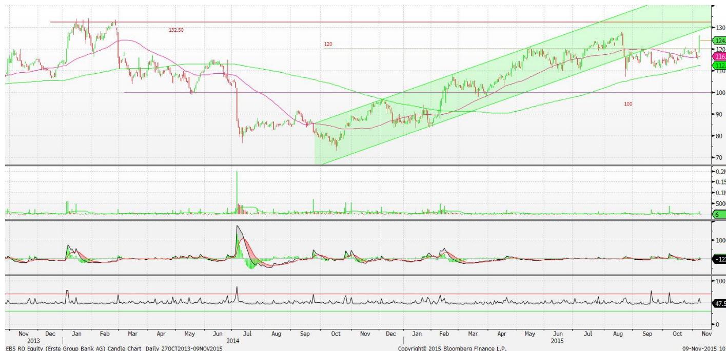
EBS RD Equity (Erste Group Bank AG) Candle Chart Daily 27OCT2013-09NOV2015 09-Nov-2015 10: